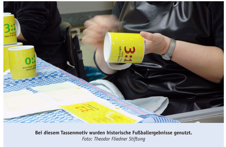
Bei diesem Tassenmotiv wurden historische Fußballergebnisse genutzt.