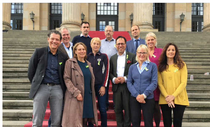
Ein Zeichen der Akzeptanz für seelische Erkrankungen: Die grüne Schleife, getragen von den Verantwortlichen aller Fliedner Kliniken und dem Krankenhaus.