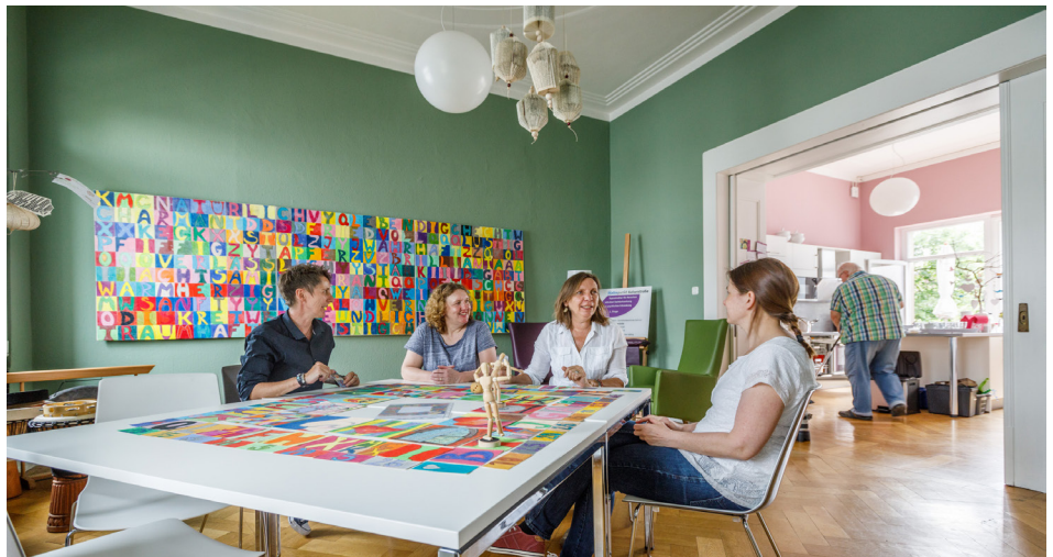
Ein Bild vor der Corona-Situation: Buntes Treiben im Haltepunkt, jetzt läuft Vieles digital.